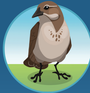
● Pájaro Bird

Remember that all things in nature have a special place. Leave them here so others can find them too.