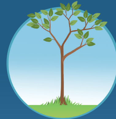
● Árbol joven Sapling (young tree)