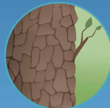
● Corteza áspera Rough bark