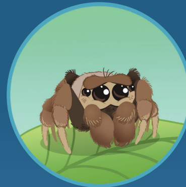
● Araña Spider