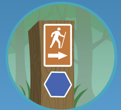
● Algo hecho por humanos Something human-made