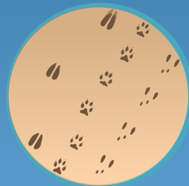
● Huellas de animales Animal tracks