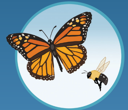
● Polinizador Pollinator