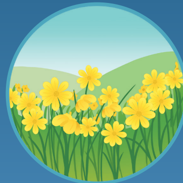
● Flor silvestre Wildflower