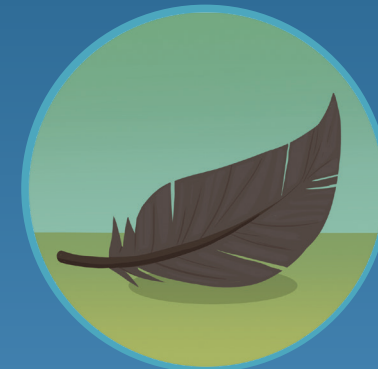
● Pluma Feather