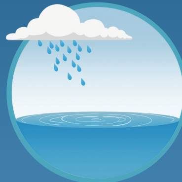
● Agua Water