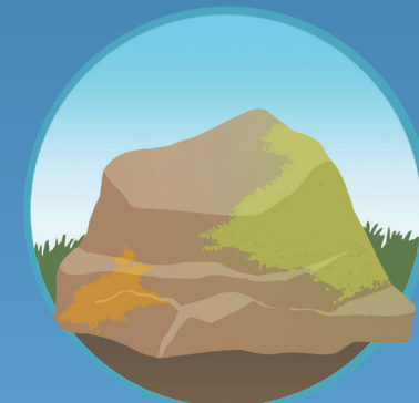
● Roca con dos colores Rock with two colors